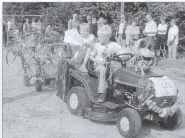
Die Mini-LPG wurde beste Kindergruppe bei den Erntewagen.