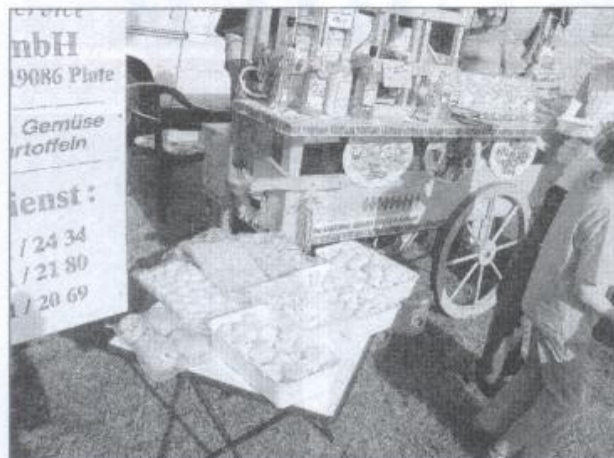
Das leckere Kartoffelangebot der KGS Plate.