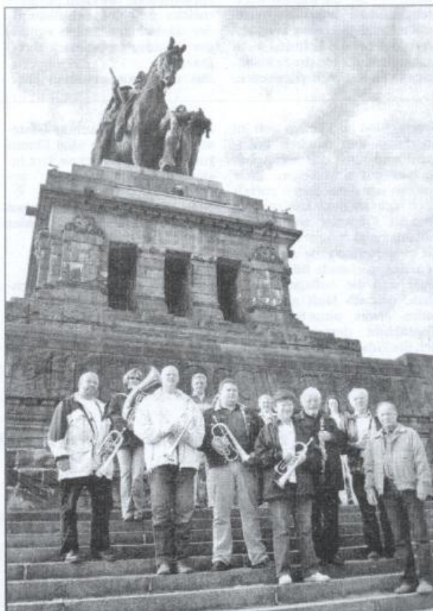
Banzkower Blasmusiker am Deutschen Eck in Koblenz.

Schwerin. Auch dort gab es ein Oktoberfest, das zugleich mit einem Wettstreit von Blasorchestern verbunden war. In diesem Wettbewerb belegten wir in der Wertung des Publikums (Dank an die Fans unseres Orchesters!) einen guten 3. Platz bei acht teilnehmenden Orchestern. Vor uns konnten sich die Pampower Blasmusik (1. Platz) und die Blaskapelle Schwetzin (2. Platz) platzieren. Im nächsten Jahr soll dieser Wettstreit mit noch mehr eingeladenen Orchestern weitergeführt werden.