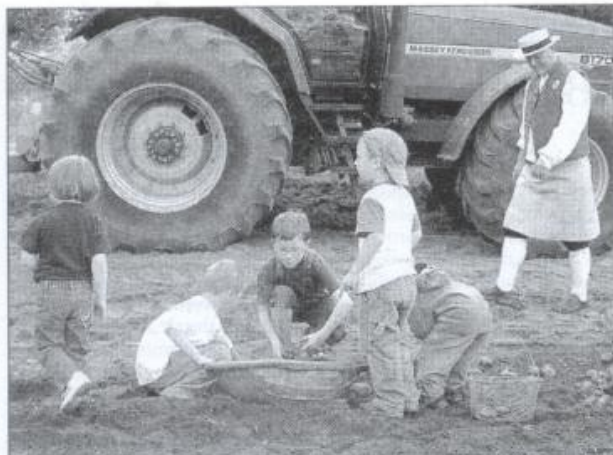
Unsere Jüngsten: eifrige Kartoffelsammler.