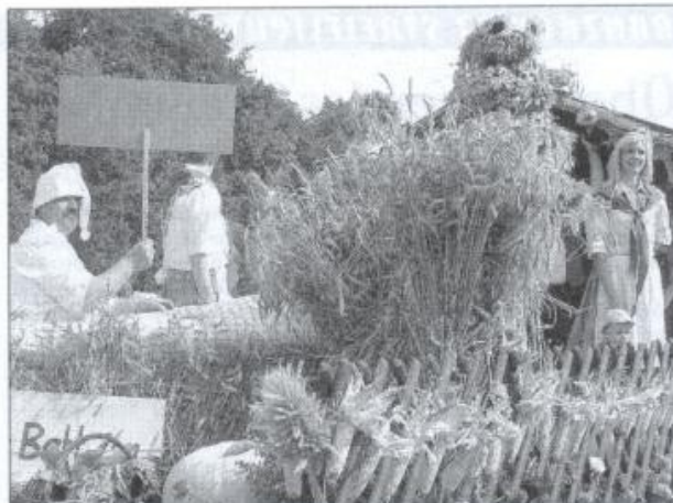
„Ein Bett im Kornfeld“.