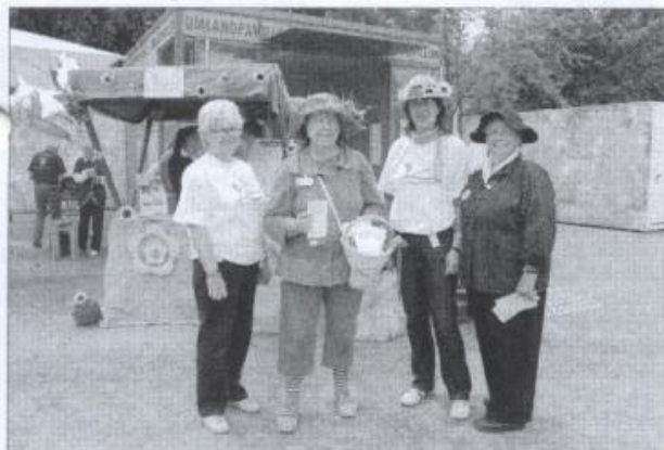
Attraktive Werbung für die Lewitz

In der Woche vom 6. bis 12. Juli präsentierte sich die Lewitz-Region im Umlandpavillon auf dem BUGA-Gelände mit einem bunten Programm. Neben umfangreichen Informationen zur Lewitz und zum touristischen Angebot gab es täglich wechselnde Aktionen, mit denen ein vielfältiges Bild vom Außenstandort vermittelt wurde. Durch handwerkliche Schauvorführungen, künstlerische Aktionen und musikalische Darbietungen konnten jede Menge Buga-Besucher angezogen werden. In Gesprächen wurde der Außenstandort Lewitz mit seinen Teilprojekten und Veranstaltungshighlights ge-