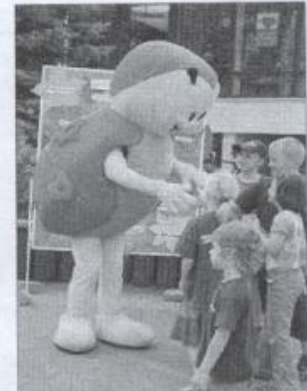
BUGA-Fiete wurde überall herzlich begrüßt