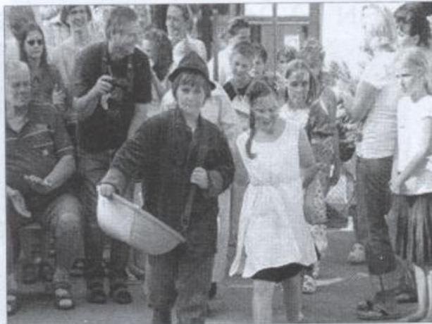
Kleine Gärtner bei der lustigen Modenschau