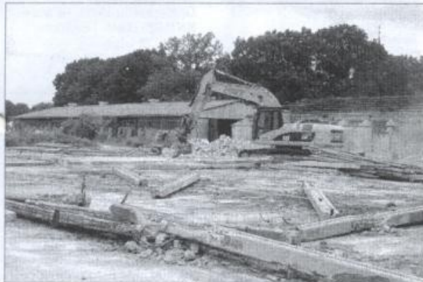
Abrissarbeiten mit modernen Baggern

Es ist weder zu übersehen, noch zu überhören: die Abrissarbeiten an der ehemaligen Kuh-/Schafstallanlage der APG Banzkow hinter der Kirche sind in vollem Gange. Damit verschwindet dieser unschöne Anblick aus unserem Dorfbild und noch in diesem Jahr wird dort Baubeginn für eine neue Betreuungseinrichtung des Lewitz-Pflegedienstes Birgit Rütz in Verbindung mit einer Wohnbebauung sein. Die vorbereitenden Arbeiten liegen voll im Plan und wir dürfen uns alle auf eine neue attraktive Investition freuen. Besonders schön ist es, dass hier zur Betreuung hilfsbedürftiger Menschen wieder neue Arbeitsplätze entstehen. Gerade das ist