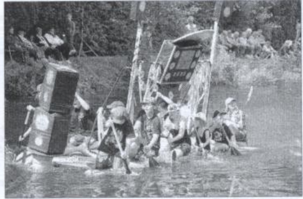
Die "Jump Styler" im vollen Einsatz

sofort viele Helfer an ihrer Seite, die das mit viel Liebe zum Detail aus einem Baumstamm geschaffene Boot wieder gemeinsam an die Oberfläche holten.