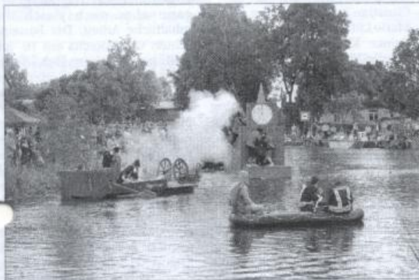
"Napoleon" belagert "Moskau"