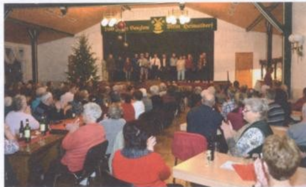
Die Goldenstädter & Jameler Plattsnackers spielten am 6. Dezember ebenso wie die Kita-Neddelradspatzen - während der Seniorenweihnachtsfeier einen Tag später - wieder vor einem voll besetzten Störtal-Haus.