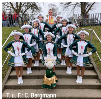
T. u. F.: C. Bergmann

trainieren, denn im Oktober wartet auf sie der nächste Wettkampf in Potsdam, die Qualifikation für die Norddeutsche Meisterschaft.