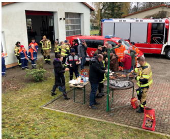
Nach getaner Arbeit – wie hier in Goldenstädt – fanden sich alle am Grill zusammen.