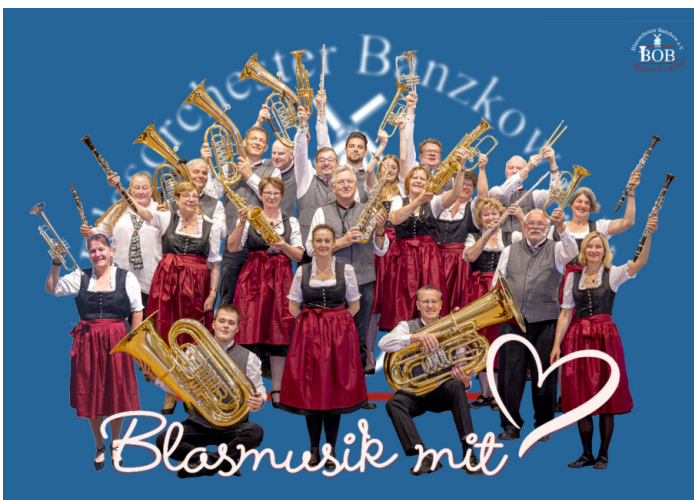
Das Blasorchester Banzkow freut sich auf seine Gäste